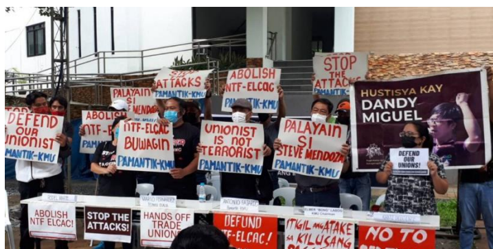
写真 CTUHRによる地方共産主義武力紛争終結国家タスクフォースへの抗議活動 32

フィリピンの労働組合が直面している大きな課題は、共産主義のテロ組織に繋がりのある団体として抑圧の対象になることである。2018年12月にドゥテルテ前大統領によって大統領令第70号が発行され、地方共産主義武力紛争終結国家タスクフォース（NTF-ELCAC 31 ）が設立された。このタスクフォースは、労働権擁護者を、ストライキを通じて社会の不安定化を意図する共産主義テロリストとみなし、摘発の対象とする。労働組合活動が妨害されるだけでなく、労働組合組織者の逮捕、強制失踪、超法規的処刑といった事例まで報告されている。こうした事態を受けて、労働組合及び人権センターは各地での実態を調査し、国際社会に向けて窮状を訴え、国内で抗議活動を展開している。