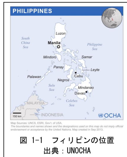
図 1-1 フィリピンの位置

後に、ロドリゴ・ドゥテルテ氏が2016年に第16代大統領に就任すると、今度は強硬な反麻薬キャンペーンが展開される。麻薬犯罪に関わる容疑者を裁判にかけること無く、逮捕の現場で警察官が射殺する「超法規的殺人行為」が多発する。こうした両大統領の強権的政治手法に対する国際的な批判は強いが、国内では幅広い支持があるようで、2022年の大統領選挙では、フェルディナンド・マルコス元大統領の長男のボンボン・マルコス氏が大統領、ドゥテルテ前大統領の長女のサラ氏が副大統領に当選した。新大統領は前政権の政策を引き継ぐと表明している。